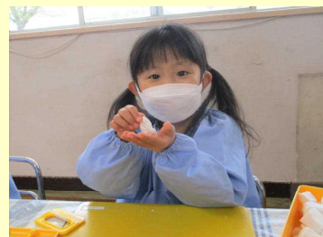
かたつむり作ったよ♫