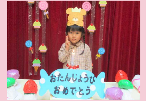
苺とぶどうが大好きです♡