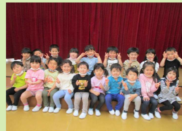
元気なもも組さん ♡ 全員集合!