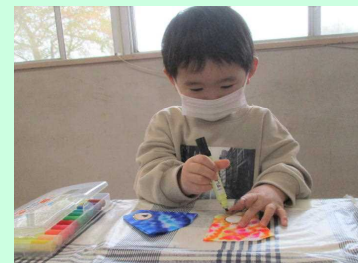
持ち方も GOOD です☆