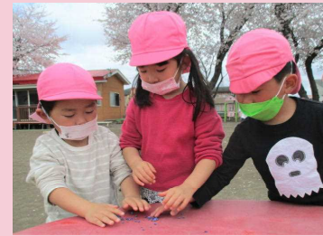
何を見つけたのかな!?