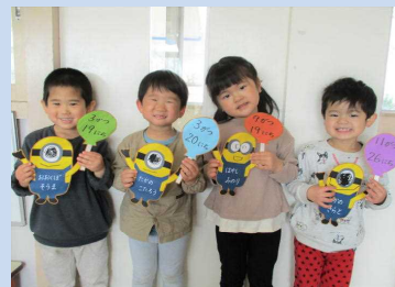
誕生表はミニオンです ♪