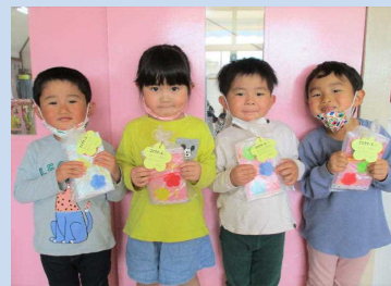
“ありがとう”の気持ちを込めて♡