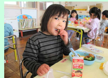
新しいお友達◎よろしくね