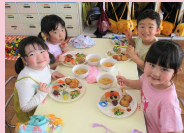
アンパンマンライスだったよ♫