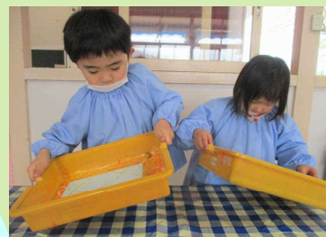
ビー玉転がし…集中してます!