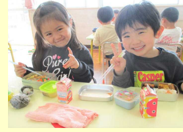
お弁当の日は朝から嬉しいね♡